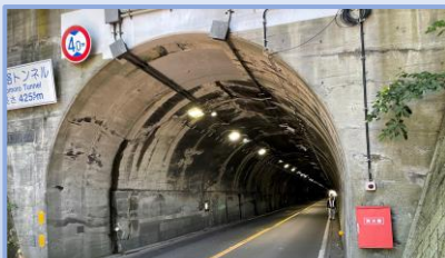
建設部門 電気工事業 公共工事の50年の実績多数